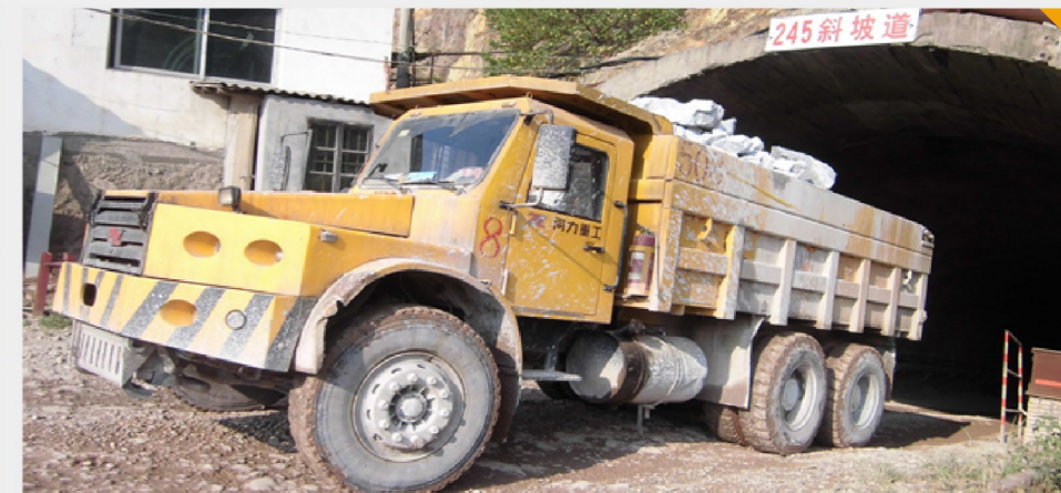
同力重工系列坑道用自卸车在紫金矿业工作图