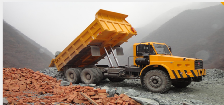
同力重工系列坑道用自卸车在陕西潼关金矿工作图