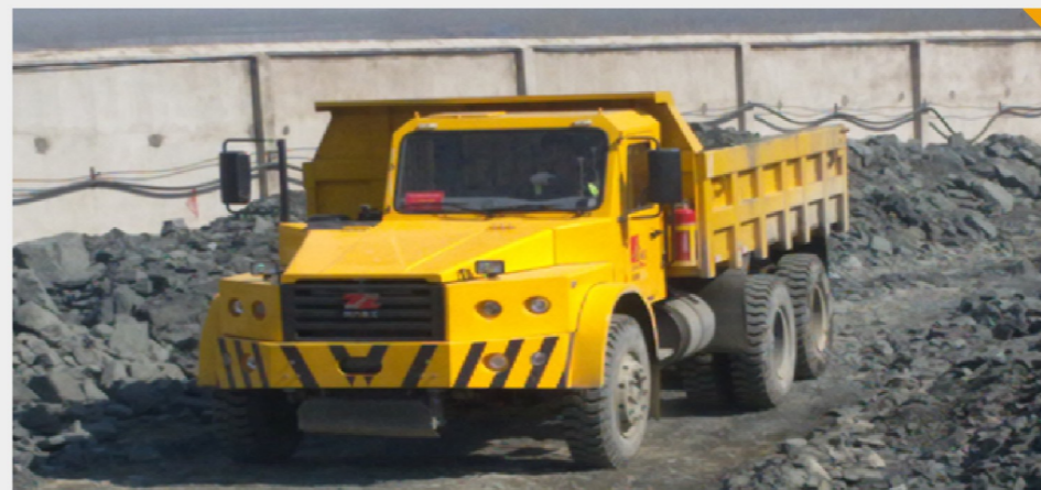
同力重工系列坑道用自卸车在山东会宝岭铁矿工作图