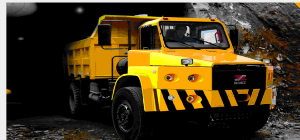
同力重工系列坑道用自卸车在云南矿区工作图